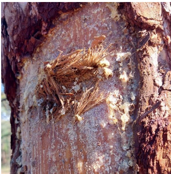
תמונה 4 – פצע עם קרע בגזע