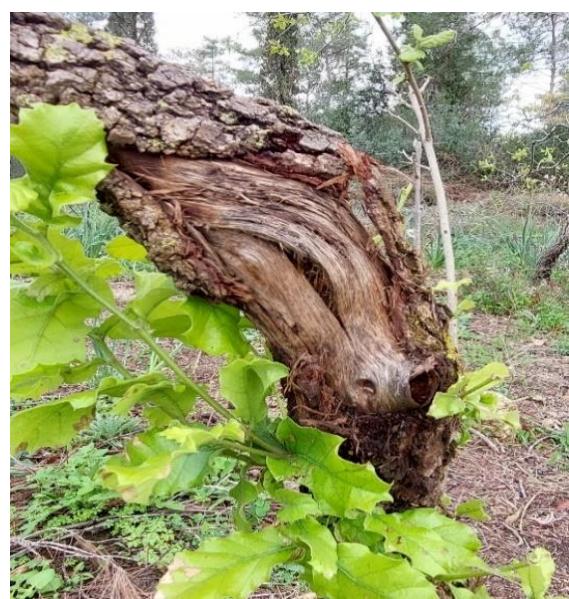
תמונה 3 – קרע בגזע עץ רחב עלים