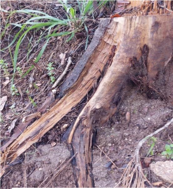
תמונה 6 – קרע בשורש ראשי