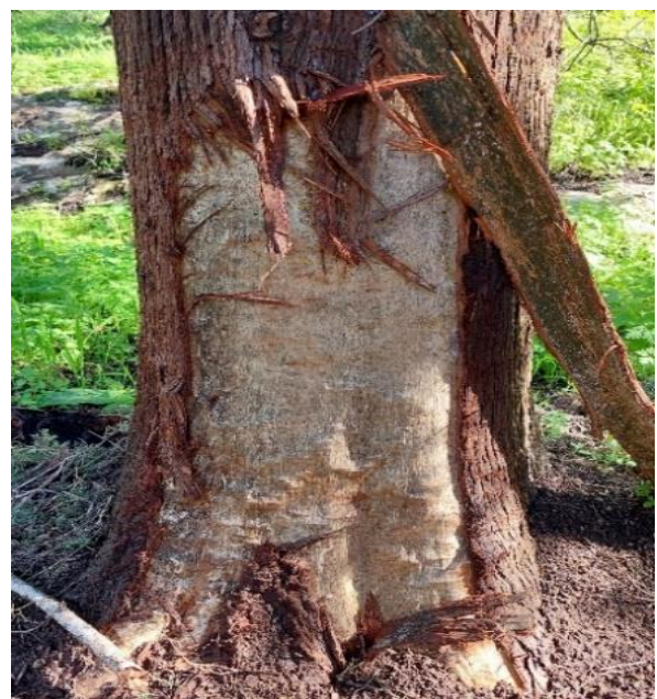
תמונה 1 – פצע מעל 400 סמ"ר