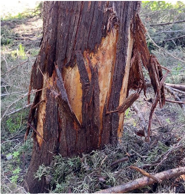
תמונה 2 – חיגור מעל 1/3 מהיקף הגזע