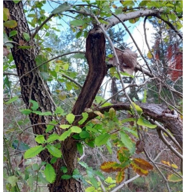
תמונה 5 – שבר לא מטופל של ענף עץ רחב